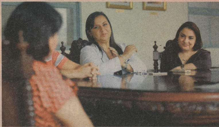
El equipo médico del San Juan es un apoyo para los pacientes.

Fuerte lucha. El joven de Hatillo nos contó que se enteró de que