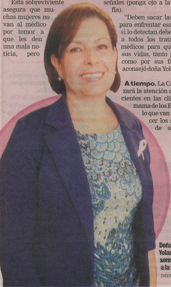
Doña Yolanda le sonríe más a la vida.

Esta sobreviviente asegura que muchas mujeres no van al médico por temor a que les den una mala noticia, pero