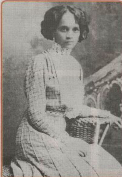
Carmen Lyra fue escritora y educadora. Nació el 15 de enero de 1887; su vida y su obra marcaron y dejaron huella en la historia social y política del país.

"Las fantasías de Juan Silvestre" y "En una silla de ruedas", publicadas en 1918, se consideran dos de sus obras más representativas. Su lucha política queda en evidencia en 1919, cuando encabezaba el movimiento contra la dictadura de los Tinoco y es en una protesta que lideraban las maestras cuando "enardecida" quemó el diario del gobierno, La Información. Como la perseguían se disfrazaba de vendedora de periódicos. Era una mujer sabia, astuta, que creía y luchaba