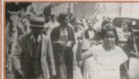
El gremio y la protesta contra la injusticia