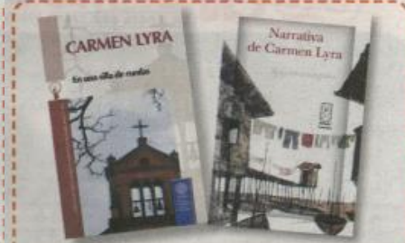
Carmen Lyra, más que por su obra literaria, es recordada por su lucha por los derechos de la mujer y los desposeídos al proponer una ley de casas baratas y el primer gremio de maestras y maestros.