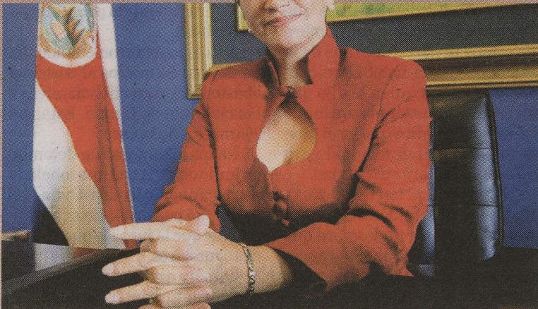
Hasta buscaron una actriz con unos aretes parecidos.