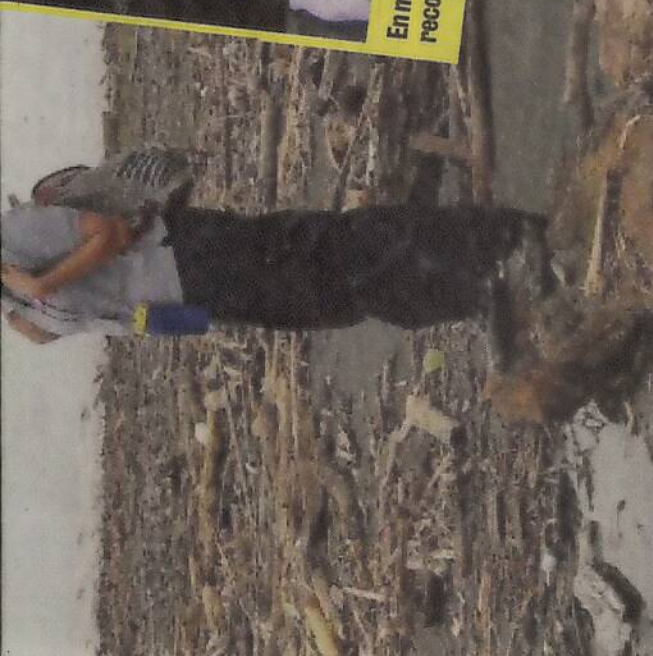
En medio de tanta angustia un abrazo sincero reconforta corazones.