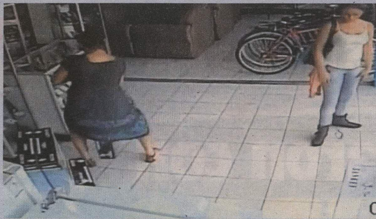
Las mujeres tienen una larga lista de golpes.

González dijo que las mujeres se ponen de acuerdo y al llegar a las tiendas una distrae a los vendedores mientras la otra esconde la mercadería en la ropa, luego sa-