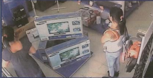
Las mujeres entran a la tienda y van directo a la pantallita.