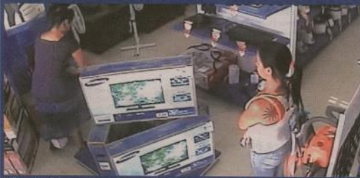
La "tragateles" se agacha y hace las suyas, la otra vigila.