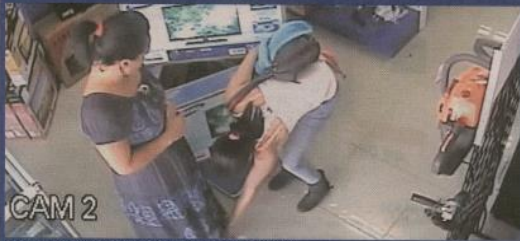
La compinche le acomoda el vestido para que no se le salga la caja.