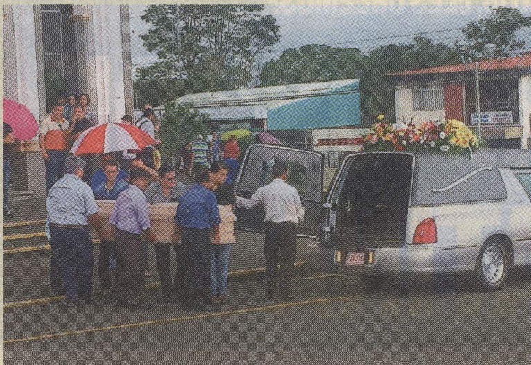
La mujer dejó una bebida de apenas 22 días de nacida. J. CALDERÓN

Los vecinos de calle Rosas escucharon una discusión y des-