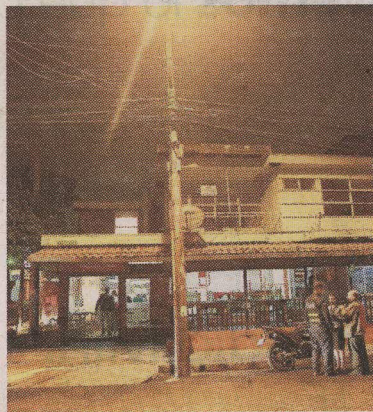
Los “polis” custodiaron a la mujer cerca del hospi. RAFAEL PACHECO.