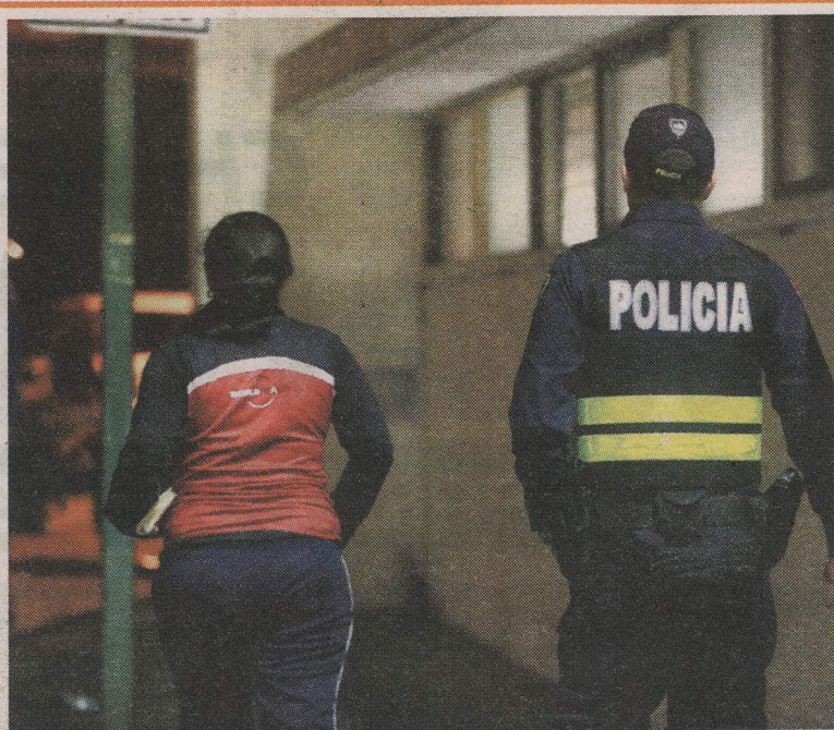
A la mamá de la menor la llevaron a los Tribunales de Goicoechea. R. PACHECO.

De inmediato, la mujer les contó lo que estaba pasando a los superior-