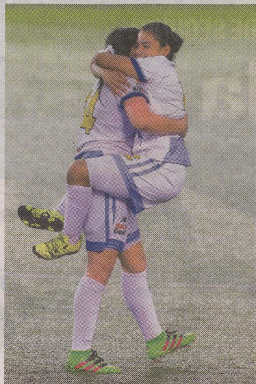
Las campeonas celebraron como se debe.