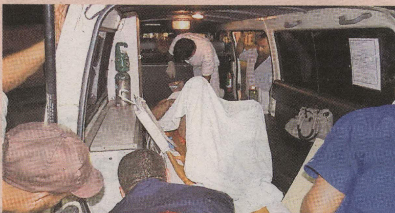
El domingo a la señora la llevaron delicada al hospital. ALFONSO QUESADA.

no que la auxilió, doña Audicia no estuviera contando el cuento, aún así no está del todo tranquila.