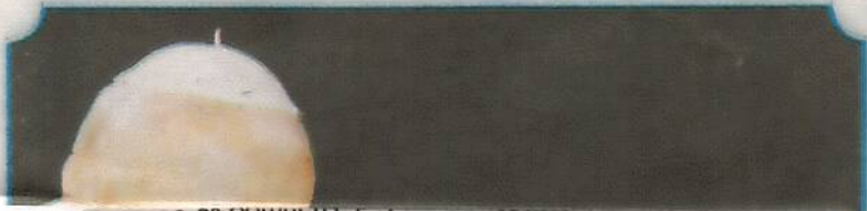
El 5 de setiembre de 1997, su cuerpo fue sepultado en la tumba que se convirtió en un santuario.