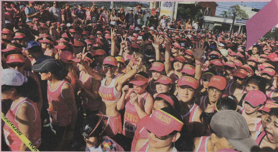
La carrera estuvo "full", llegaron unas cinco mil mujeres a ponerle bonito.