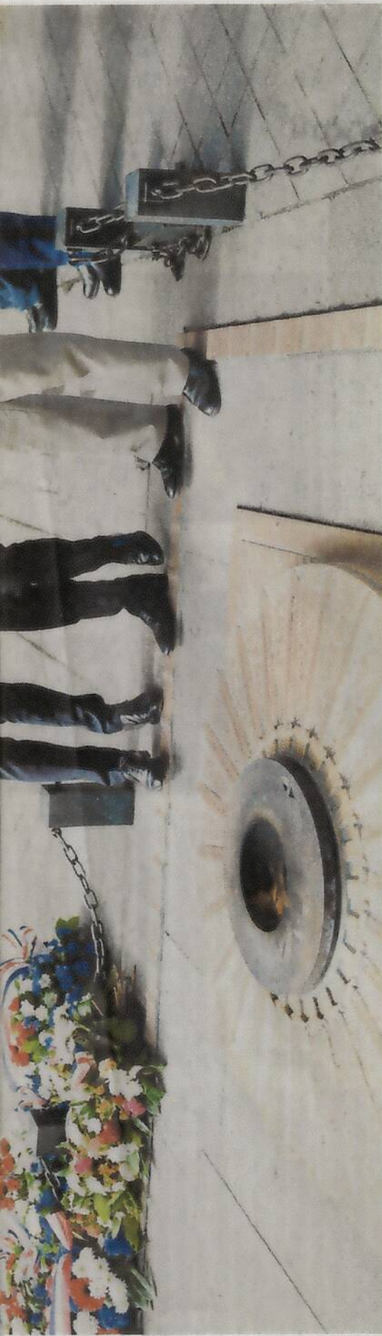
El presidente saliente de Francia, François Hollande (centro), y su sucesor, Emmanuel Macron (izquierda), participaron el lunes en un acto conmemorativo de los 72 años de la rendición alemana en la Segunda Guerra Mundial. El acto tuvo lugar en el Arco del Triunfo, en París.

➔ Presidente electo necesita fuerza política en la cámara para impulsar planes