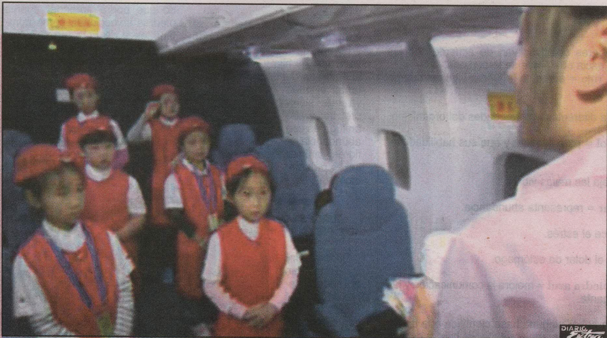
El sexismo está instalado en cada esquina de la vida en China, sin embargo se está tratando de combatir los arraigados estereotipos de género. (SEP)

El sexismo está instalado en cada esquina de la vida en China y la gente está tan acostumbrada a ello que es fácil ignorarlo, porque la gente se acostumbró a la idea de que los hombres pueden hacer mejor las cosas que las mujeres. Pero cuando las mujeres comenzaron a sobresalir, la gente se volvió temerosa y pensó que eso sería problemático.