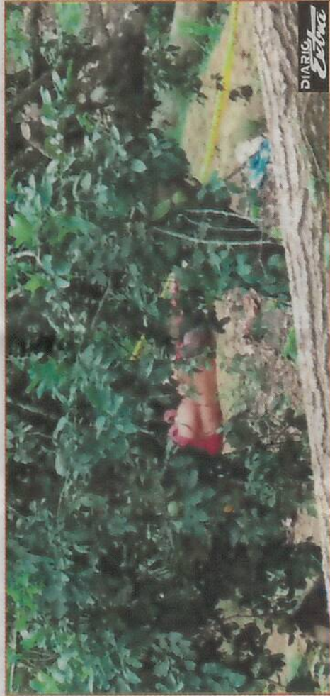
El cuerpo sin vida de doña Ana Vita yacía cerca de un tanque de agua.