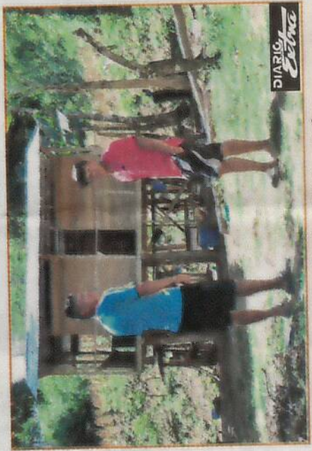
DIARIO EXTRA (der.) relataron que nunca antes vieron algo así en Conté y que el sujeto era tranquilo, nunca pensaron que mataría a nadie.