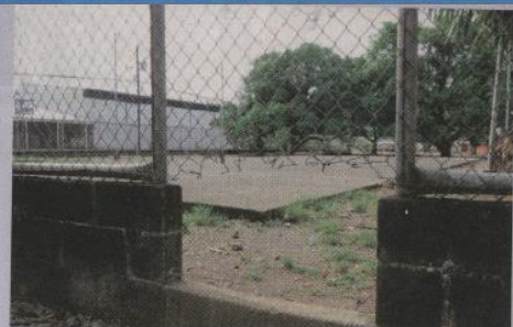
El papá se metió a la escuela por este hueco. E. CHINCHILLA

♦ ÉDGAR CHINCHILLA Y SILVIA COTO silvia.coto@tejea.co.cr