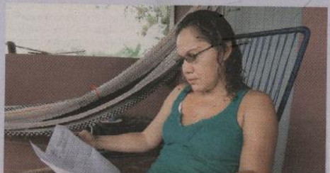
Doña Zaida también denunció una presunta agresión contra la hija.

Don Jason asegura estar arrepentido de haberle pegado al maestro frente a los chiquitos y aprove-