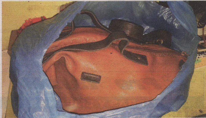
En el lugar decomisaron un bolso que pertenecería a la víctima.

Según la información que tiene el OIJ, el sospechoso le dijo a la muchacha que se bajara del carro, ella lo hizo y él la metió a la fuerza en un charral de Grecia, donde, al pare-