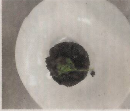
Este es el arroz negro que la tica

(el 24 de octubre) y tomarse fotos con personajes como Simeone?