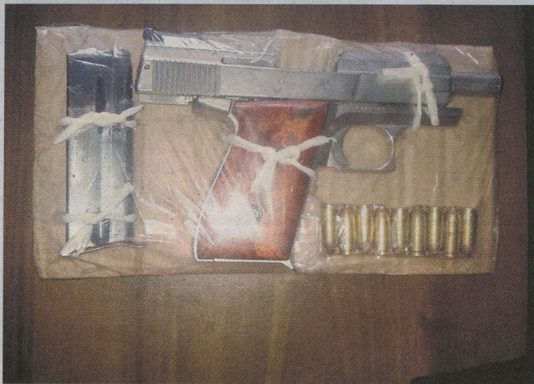
El estudiante de quinto grado andaba esta pistola.