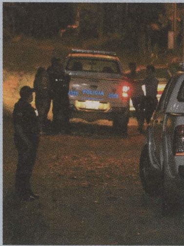
El miércoles en la noche a una mujer, de 23 años, la mataron a balazos. ARC.