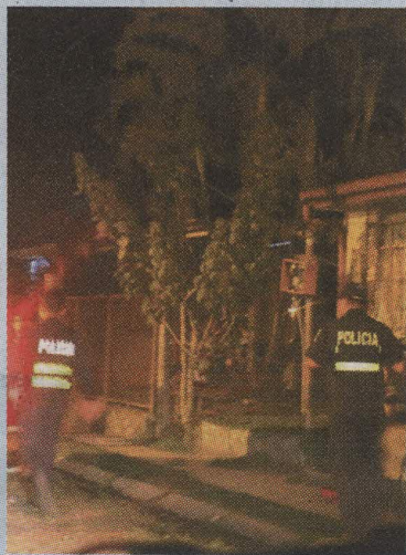
En el primer tiroteo resultó herida una menor, de 14 años.