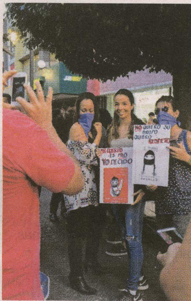
Las mujeres piden que las respeten en las calles y en todo lado.

son nuestras” cientos de mujeres y unos cuantos hombres caminaron desde el costado sur del Banco Central por la avenida Central hasta llegar a la plaza de la Cultura.