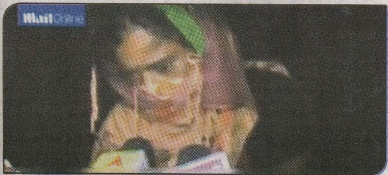
La familia de la mujer no tenía los recursos para saldar la multa, por lo que el principal jefe tribal, que según la policía es un familiar lejano de la mujer, ordenó entonces la violación grupal. (SEP)

India ha endurecido las leyes sobre violencia sexual, tras la violación de una mujer en un autobús en Nueva Delhi en 2012, que provocó consternación en todo el país.