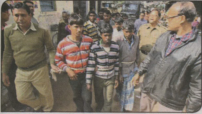
La policía arrestó parte de los sospechosos acusados en un caso de violación y en grupo son llevados por la policía a un juzgado. Igualmente al jefe tribal que dio la orden. (SEP)