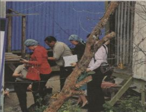
Judiciales recogieron evidencias dentro de la casa en que asesinaron a la muchacha. JOVENVARIO