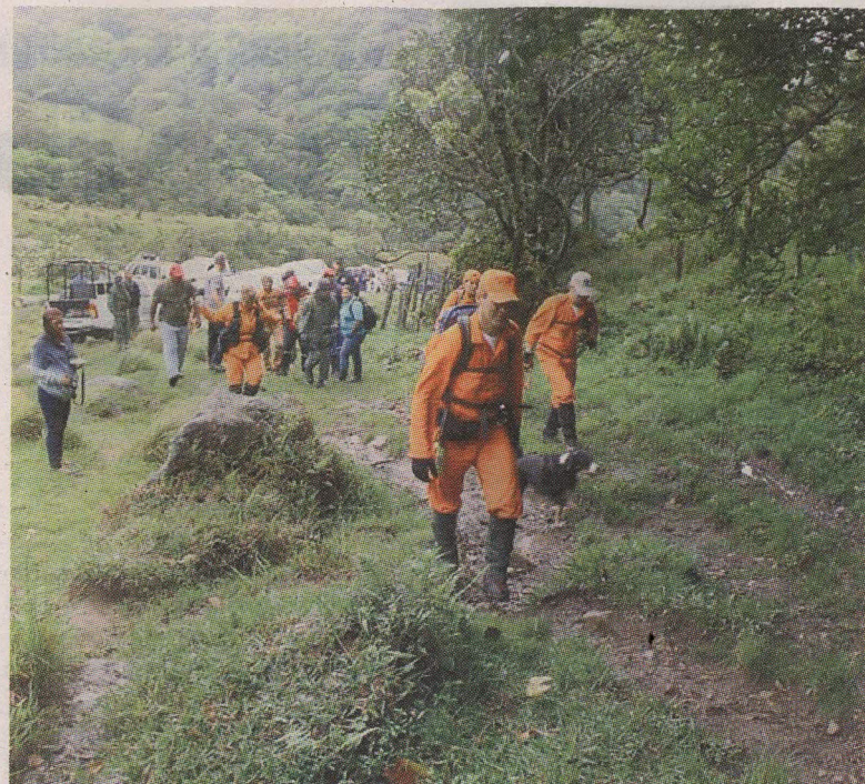
Los equipos de búsqueda siguen recogiendo evidencias.

Las jóvenes fueron declaradas desaparecidas el 2 de abril cuando un guía turístico de Boquete, en donde ambas se hospedaban, dio aviso a la Policía de que no habían regresado a dormir.