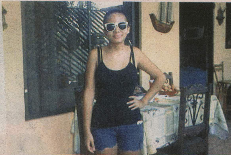
La menor vestía de negro cuando se le vio por última vez.

En el mensaje se detallaba el supuesto lugar en el que estaba la menor con los amigos, pero los agentes judiciales fueron y no encontraron a nadie.