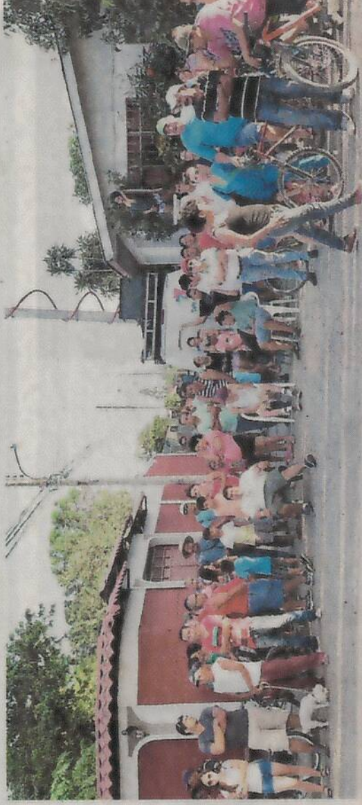
Todo el barrio La Victoria salió a la calle. La gente está muy sorprendida por lo que pasó. ALONSO TENORIO