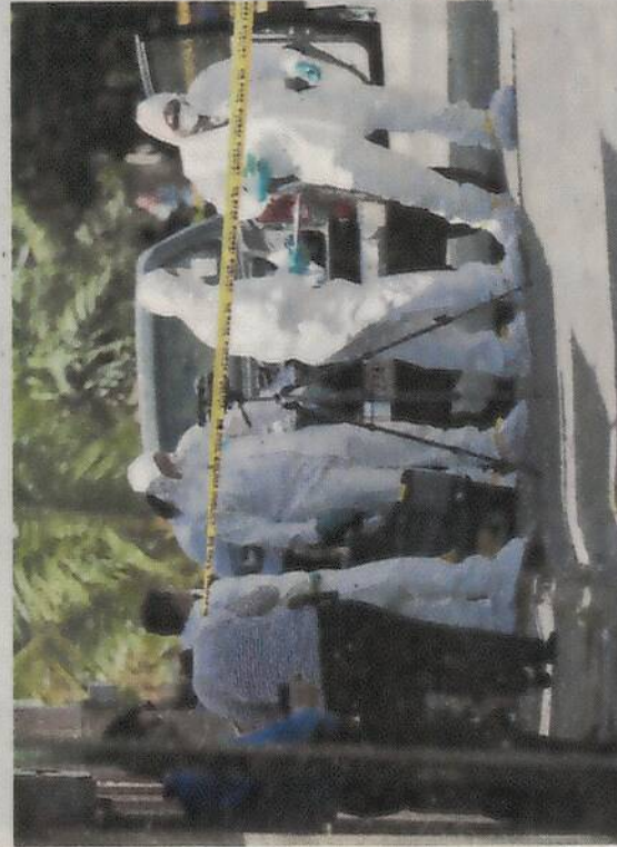
Agentes se pusieron trajes especiales para no contaminar la escena. ALONSO TENORIO