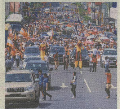
Mujeres, hombres y niños llenaron la Avenida Segunda. JONATHAN JIMÉNEZ