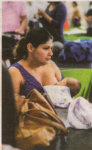
Las asistentes les dieron de comer a sus bebés en el “food court”. G. TÉLLEZ

Esta vez, las madres volvieron a exigir que se les respete el derecho de sus hijos a ser alimentados, ade-