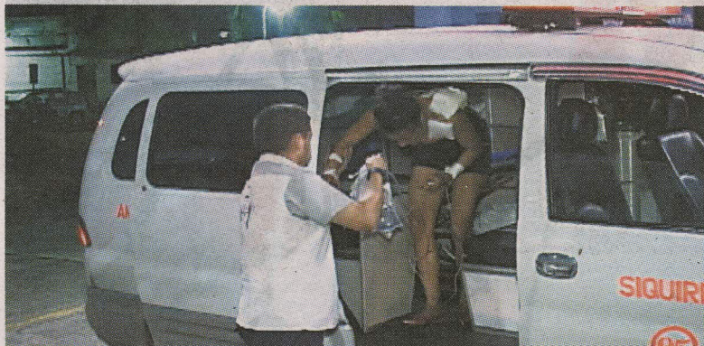
A la mujer la llevaron al hospital Tony Facio de Limón.