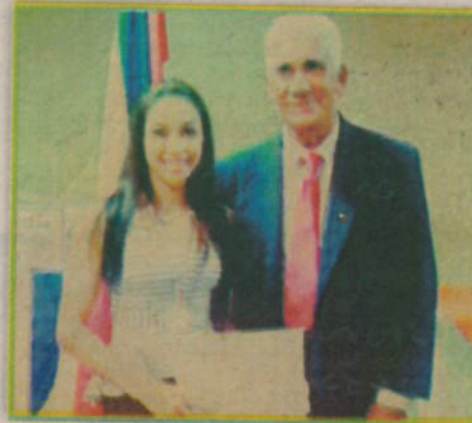
En 2015, recibió un reconocimiento a la Mejor Atletista del Año.