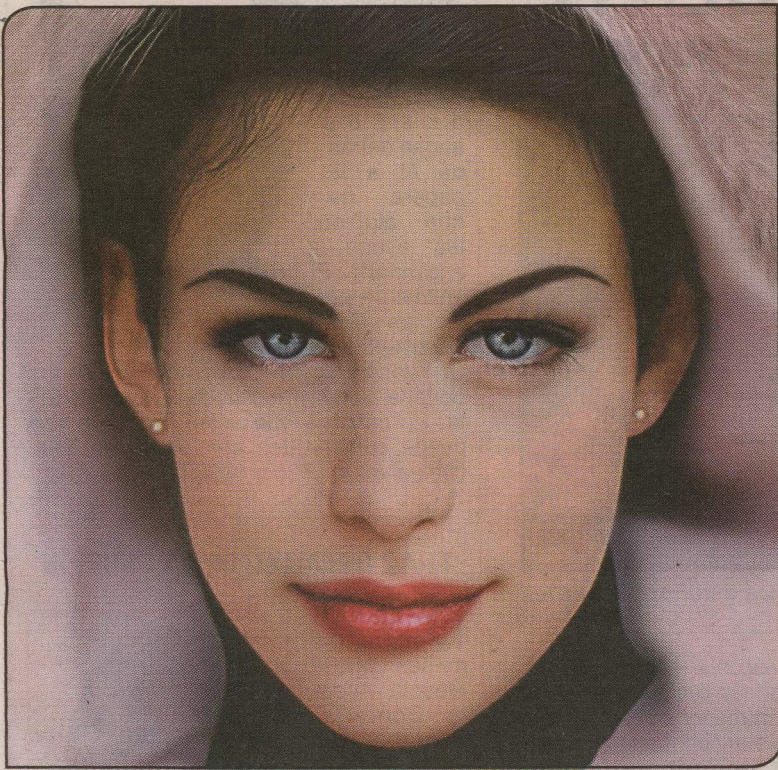
Los científicos creen que en el caso de las mujeres, el efecto de atracción sexual y la costumbre de juzgar a través de la belleza distorsionan la percepción. (SEP)