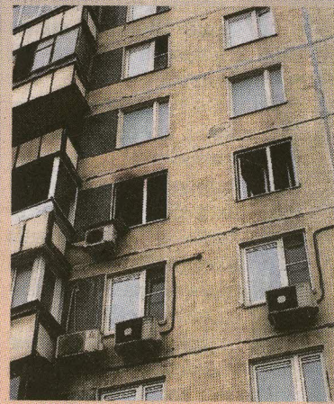
La niñera incendió el apartamento.

Según el canal de TV Svezdá, la madre de la pequeña fue hospitalizada al caer inconsciente al enterarse del trágico suceso.