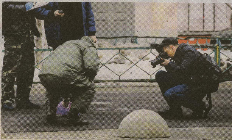
Las autoridades rusas rodearon rápido la zona.

Según informaron las autoridades, la detenida era la niñera de una familia de ese mismo barrio que, aprovechando que los padres habían salido de casa con el hermano mayor, asesinó por la mañana a la niña de cuatro años a la que cuidaba, le prendió fuego al apar-