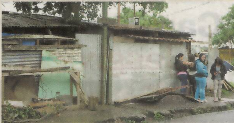
Los vecinos del barrio San Martín esperan que la chiquita regrese a la casa sana y salva.