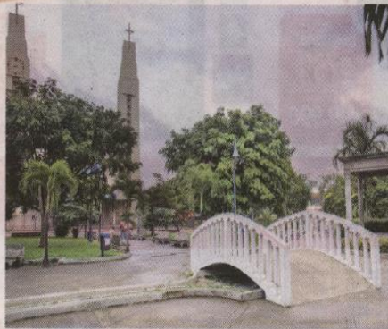
El asalto ocurrió en las cercanías del parque de Pérez Zeledón. LUIS NAVARRO

Seguramente siente asquillo por saber el viaje que hizo.