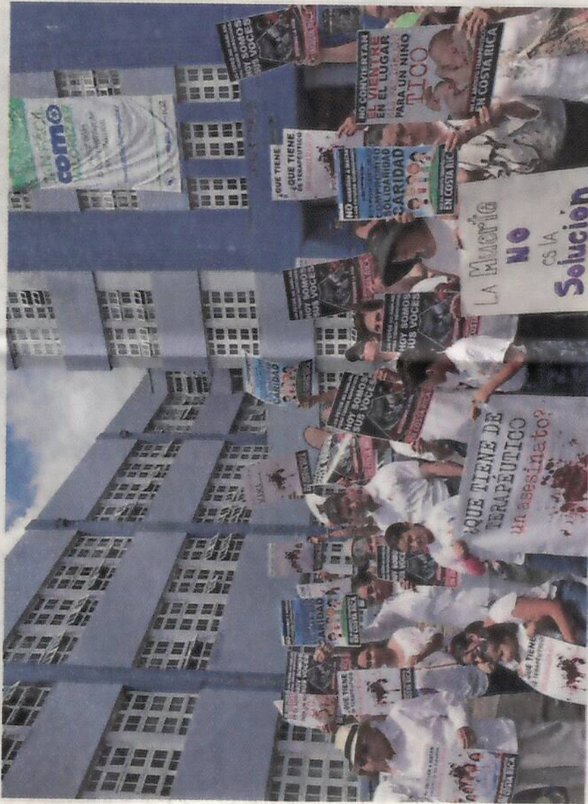
Decenas de feligreses católicos acudieron este 2 de junio a manifestarse ante el Ministerio de Salud contra lo que creen son intenciones de legalizar el aborto.

genes del aborto bajo la modalidad terapéutica durante este gobierno de Luis Guillermo Solís, dos años después de haberse juramentado presidente en un acto sin los rezos de siempre, pero sí con la Biblia en la mano.