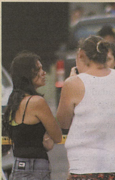
Los familiares estaban muy dolidos.