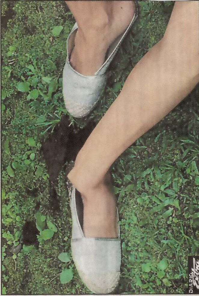
La mujer se fracturó el pie izquierdo.

suntamente desde su casa ubicada en barrio Los Maderos de Guápiles.