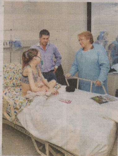
El encuentro duró cerca de una hora.