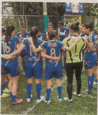
Las subcampeonas van con todo.