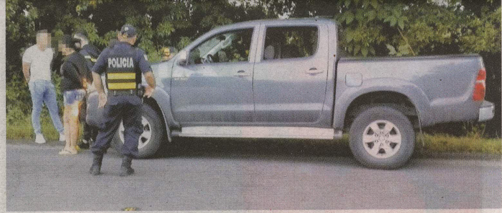
La modelo y su hermana fueron llevadas al Buen Pastor. R. MONTERO