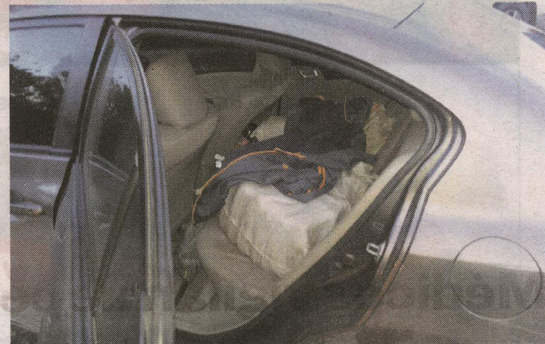
Los paquetes iban medio camuflados.

Ariza ha destacado en desfiles y se ha tomado fotos en traje de baño y en ropa interior; tiene más de ocho años de modelar.