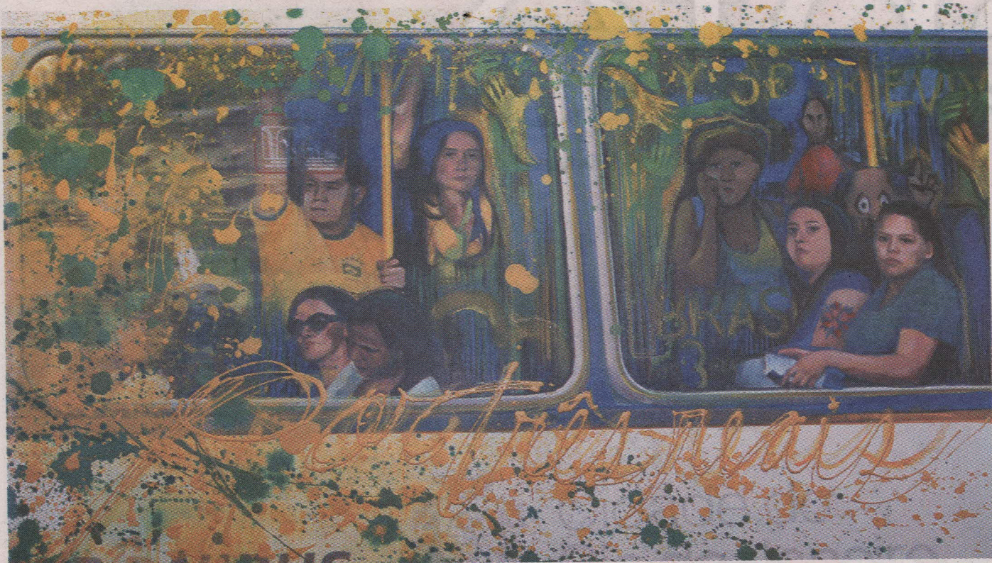
Las impresiones son parte de su trabajo técnico.