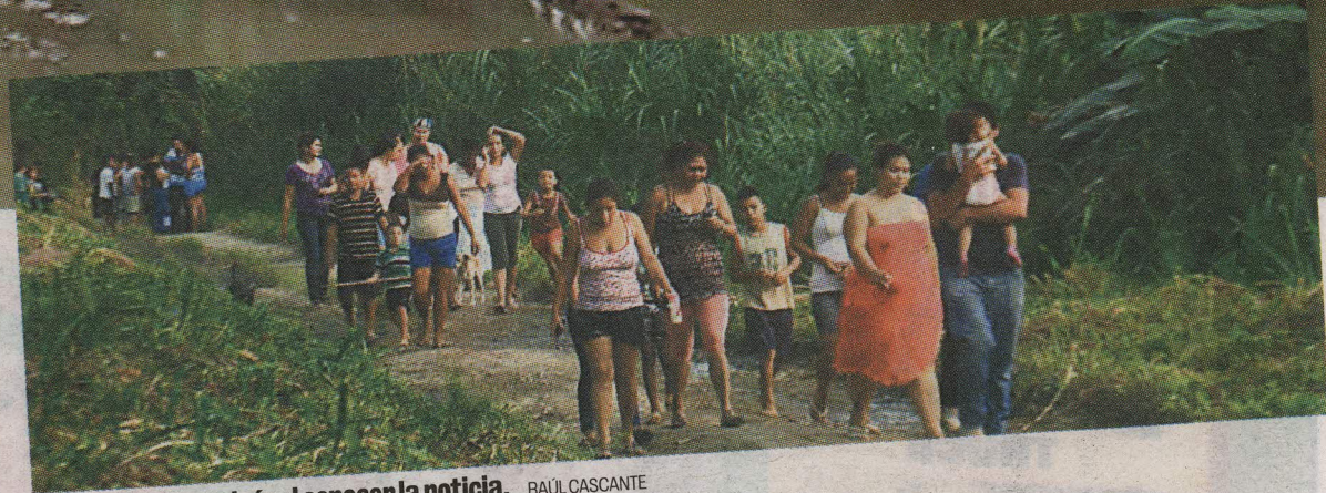
Vecinos llegaron al río al conocer la noticia. RAÚL CASCANTE