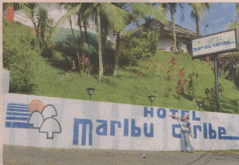
La víctima tenía casi 11 años de trabajar en este hotel. RAÚL CASCANTE.

ANCIANO DE 70 AÑOS LE DISPARÓ A UN SUPUESTO LADRÓN