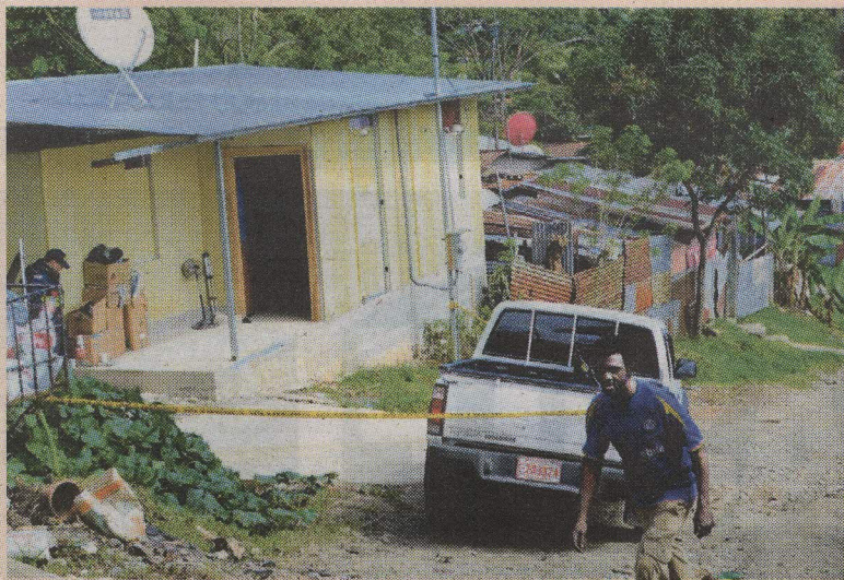
La Fuerza Pública custodió la casa de la pareja. RAÚL CASCANTE.