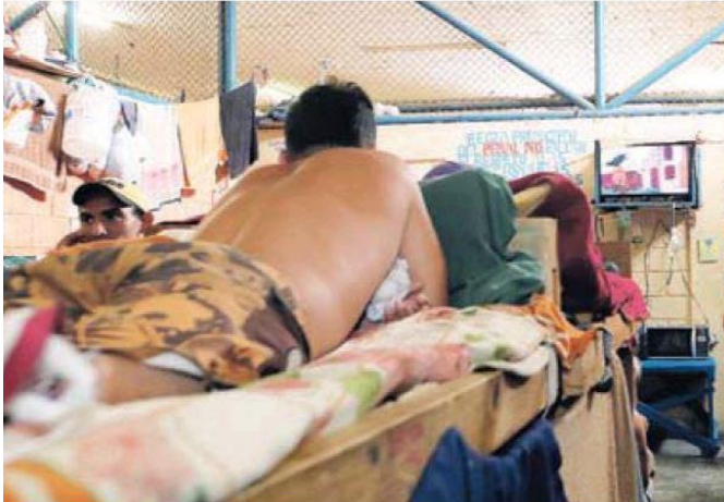
En el pabellón B del ámbito de pensiones de La Reforma hay 58 detenidos.