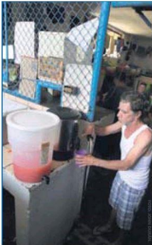
Los reclusos se quejan de la comida y de cantidad de males.

desea tener hijos puede hacerlo, pero sabiendo las responsabilidades que tiene y con la certeza de que puede cumplir