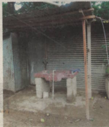
En el ranchito no hay ni un alma.