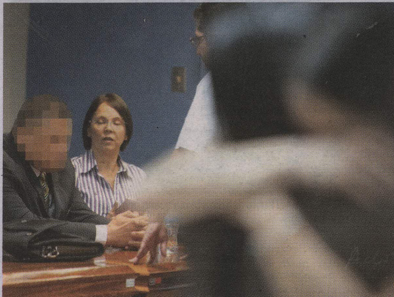
El acusado estará seis meses en prisión preventiva mientras la sentencia queda en firme. LUIS NAVARRO

Sin embargo, en este debate solo se le acusó a Alan por uno de los delitos.