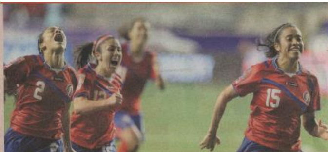
Las seleccionadas salieron sopladitas a celebrar con Díaz.

✦ ANDRÉS MORA M. andres.mora@kotoja.co.cr