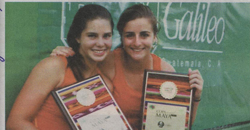
Dani ganó junto con Barbara Rodríguez el título de dobles femeninos en el torneo ITF de El Salvador en junio del 2011.

◆ ANDRÉS MORA M. andres.mora@lateja.co.cr