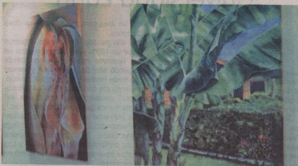
Los colores predominan en sus trabajos, porque afirma que forman parte importante de cada cuadro.