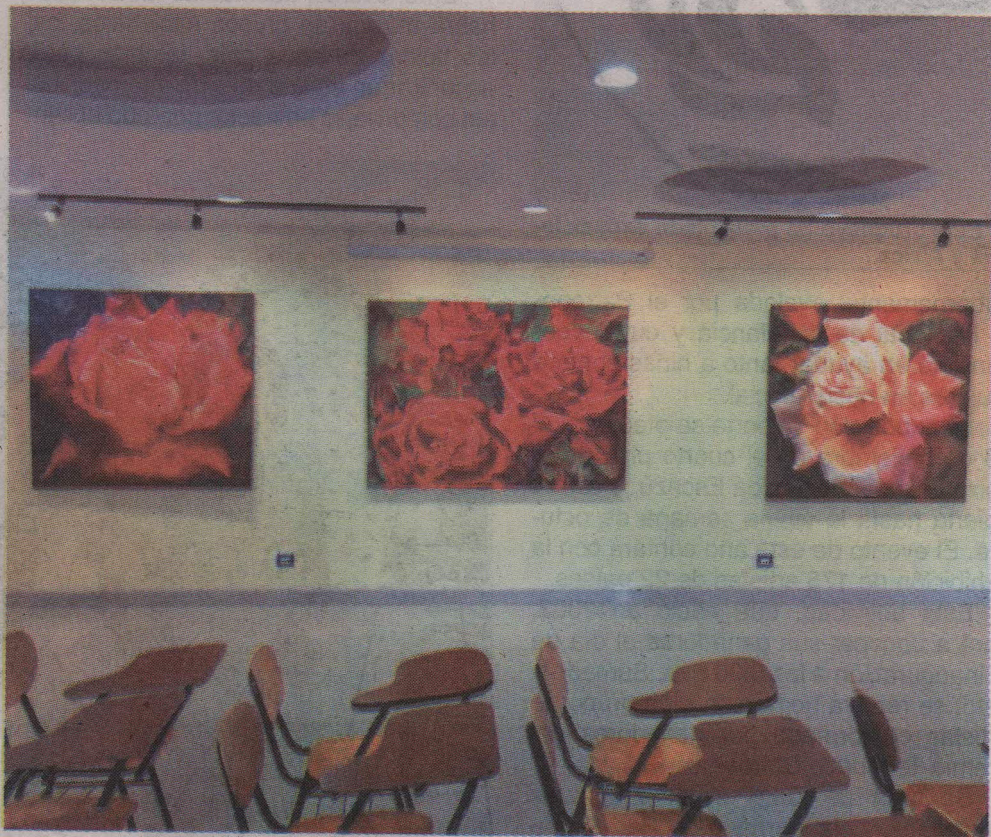
Esta exposición se mantendrá en la Fundación de Estudios Brasileños en la sede de Paseo Colón.

Siempre pinta óleo y, entre otras obras, elabora cuadros infantiles en la técnica de acrílico, aunque para ella el óleo consiste en la técnica preferida, porque la hace sentir mayor placer cuando ve su trabajo terminado. Para el futuro no cree que haga otra cosa, asegura que su vida es la pintura y así se mantendrá por muchos años más.